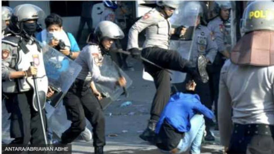
Polisi memukul mahasiswa di depan kantor DPRD Sulawesi Selatan, Makassar, Selasa (24/09).