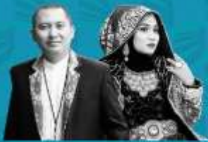
Mereka yang Terlibat dalam Pusaran FT