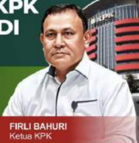
FIRLI BAHURI Ketua KPK

Ketua KPK, Firlu Bahuri akan beri perlawanan hukum usai jadi tersangka kasus dugaan pemerasan terhadap mantan Menteri Pertanian Syahrul Yasin Limpo