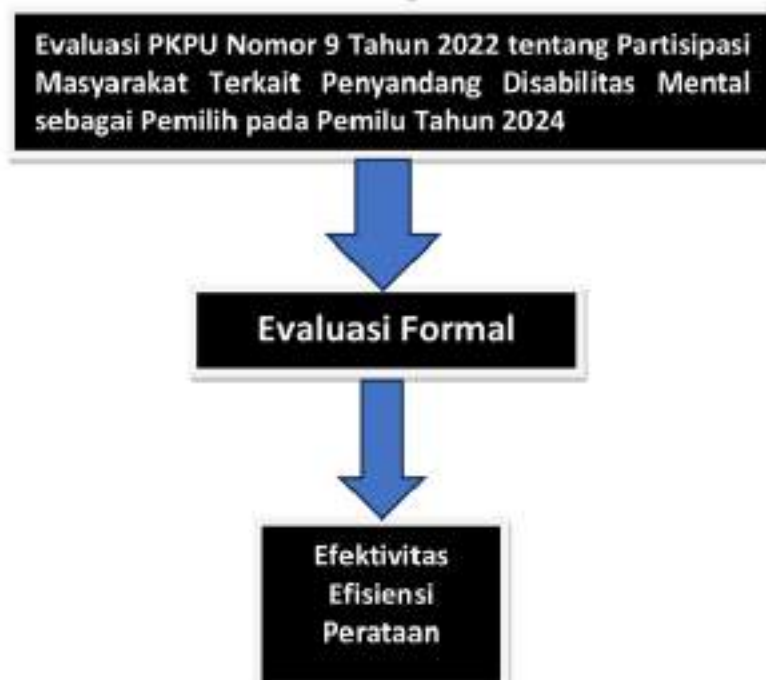
Gambar 1. Kerangka Penelitian

Selain itu, kajian ini juga menggunakan sumber data lain melalui wawancara dengan sejumlah tokoh kunci dari penyelenggara pemilu (KPU) pusat, organisasi masyarakat terkait penyandang disabilitas, seperti Perhimpunan Jiwa Sehat (PJS), dan Pusat Pemilihan Umum Akses Untuk Disabilitas Penyandang Cacat (PPUAD Penca). Berikut gambaran tentang kerangka penelitian yang diterapkan dalam kajian ini.