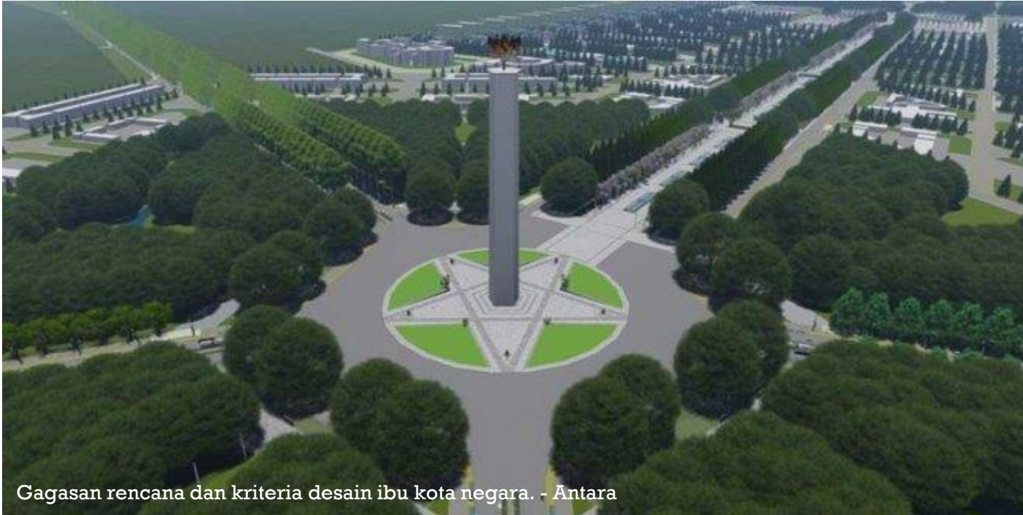
Gagasan rencana dan kriteria desain ibu kota negara.