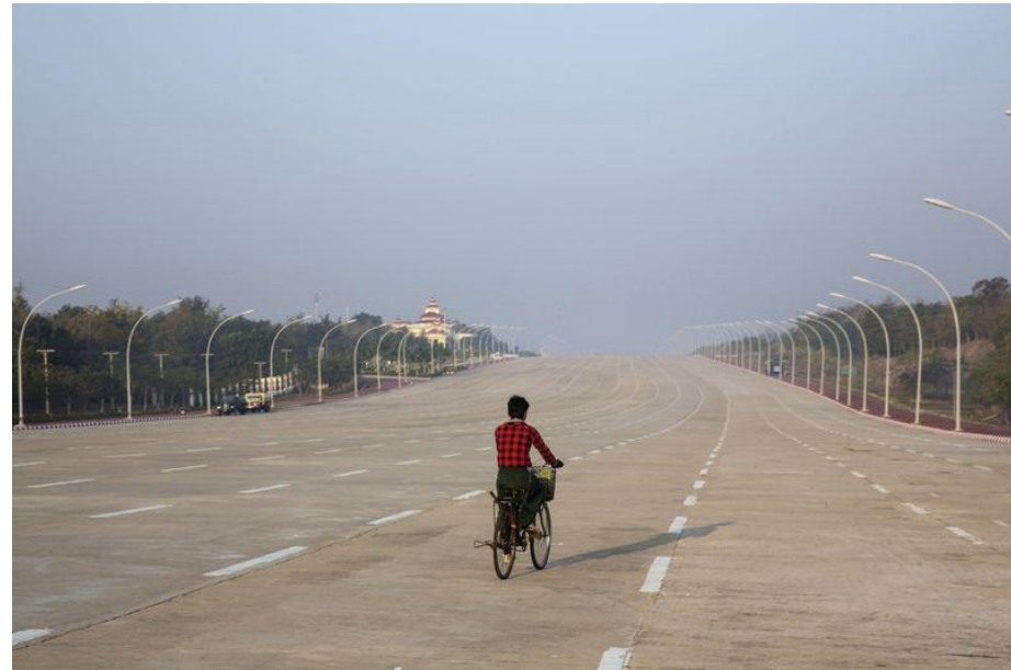
Penampakan jalan tol Naypyidaw yang kosong