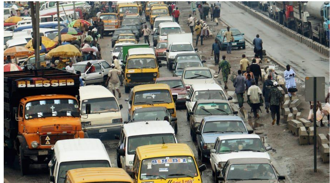
Macetnya Kota Lagos